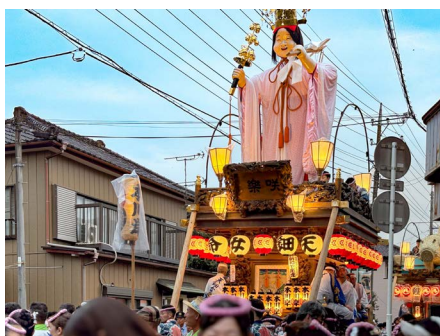
▲ 新たな年番「天細女命」。