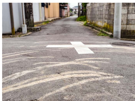
▲ 町中には「の」の字廻しの跡が。