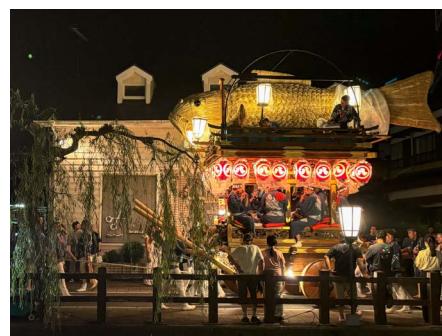
▲ 夜の祭りも幻想的！